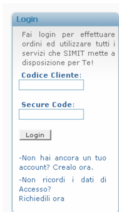
Figura 1 – Box per l'accesso e registrazione al sito

Per registrarsi è sufficiente individuare il box di Figura 1, sempre presente in qualunque pagina del nostro sito sulla sinistra, e fare click sul link "Crealo Ora":