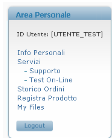
Figura 5 – Box con le funzioni dell'area personale

Dopo aver fatto l'accesso il box di figura 1 scompare e al suo posto appare il box di figura 5 nella quale è possibile utilizzare le seguenti funzionalità personalizzate: